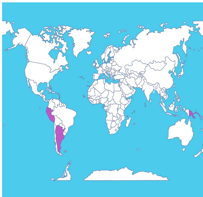
Consolidado por Región